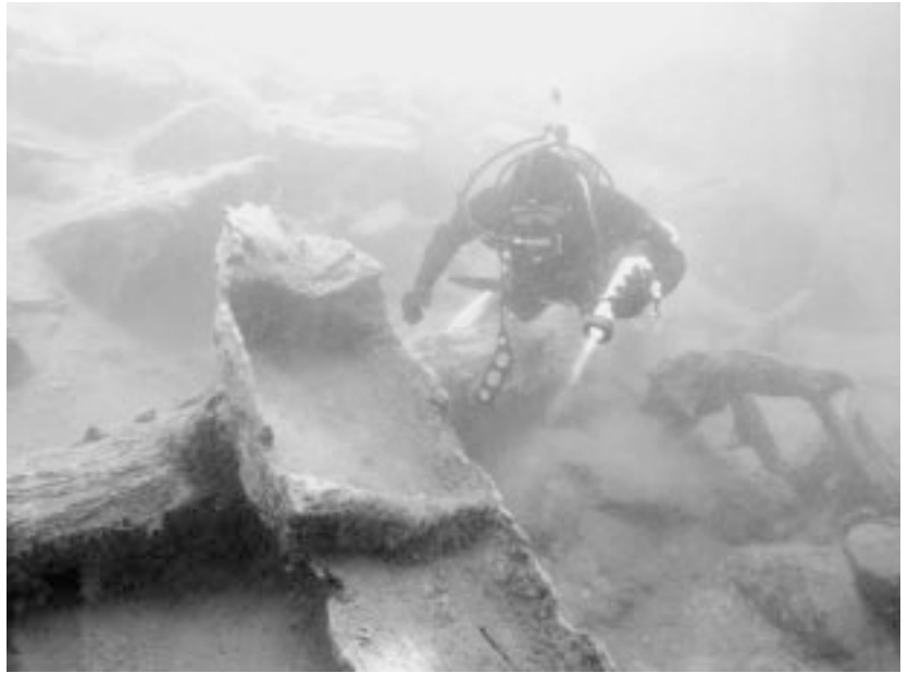
Abb. 1: Obersee, Gem. St. Jakob/Deferegg. Mittelalterlicher Einbaum in Fundlage, September 2000. Im Zuge der Bergung des Einbaums wurde auch der darunterliegende Stamm für eine dendrochronologische Untersuchung beprobt.

In zwei Tauchgängen konnte im Spätsommer 1999 der vermutete Einbaum als ein am felsigen Nordhang, in 8 bis 10 m Tiefe liegendes, nicht eingesedimentiertes, jedoch stark erodiertes Wrack identifiziert werden (Abb. 1). Mit einer Länge von knapp 3,50 m scheinen zwei Drittel des Wasserfahrzeuges erhalten, was auf eine ursprüngliche Gesamtlänge von ca. 5 m schließen lässt. Aus den spärlichen typologischen Merkmalen des Bootes wie zwei spantenartigen Querrippen und relativ flachem Boden bzw. kaum vorhandenen Bearbeitungsspuren konnten jedoch keine eindeutigen Rückschlüsse auf das Alter gewonnen werden (Abb. 2). Erst die Radiokarbondatierung einer Holzprobe ergab eine erste Einordnung des Objektes in die Zeit des 10./11. Jahrhunderts n. Chr. (siehe unten). Dadurch kommt dem mittelalterlichen Einbaum insbesondere im Zusammenhang mit der Lage des Obersees auf über 2000 m Seehöhe eine außergewöhnliche Bedeutung zu, dürfte er doch das bislang höchstgelegene archäologisch erforschte Wasserfahrzeug Europas darstellen. Dieser Umstand rechtfertigte in weiterer Folge nach eingehenden Vermessungs- und Dokumentationsarbeiten an der Fundstelle im Frühjahr 2000 eine sorgsam geplante und unter abermaliger Mithilfe der Wasserrettung Lienz mustergültig durchgeführte Bergung des Einbaumes im September des selben Jahres. Nach der nun abgeschlossenen Auswertung in Innsbruck wird der Einbaum nach erfolgter Konser-