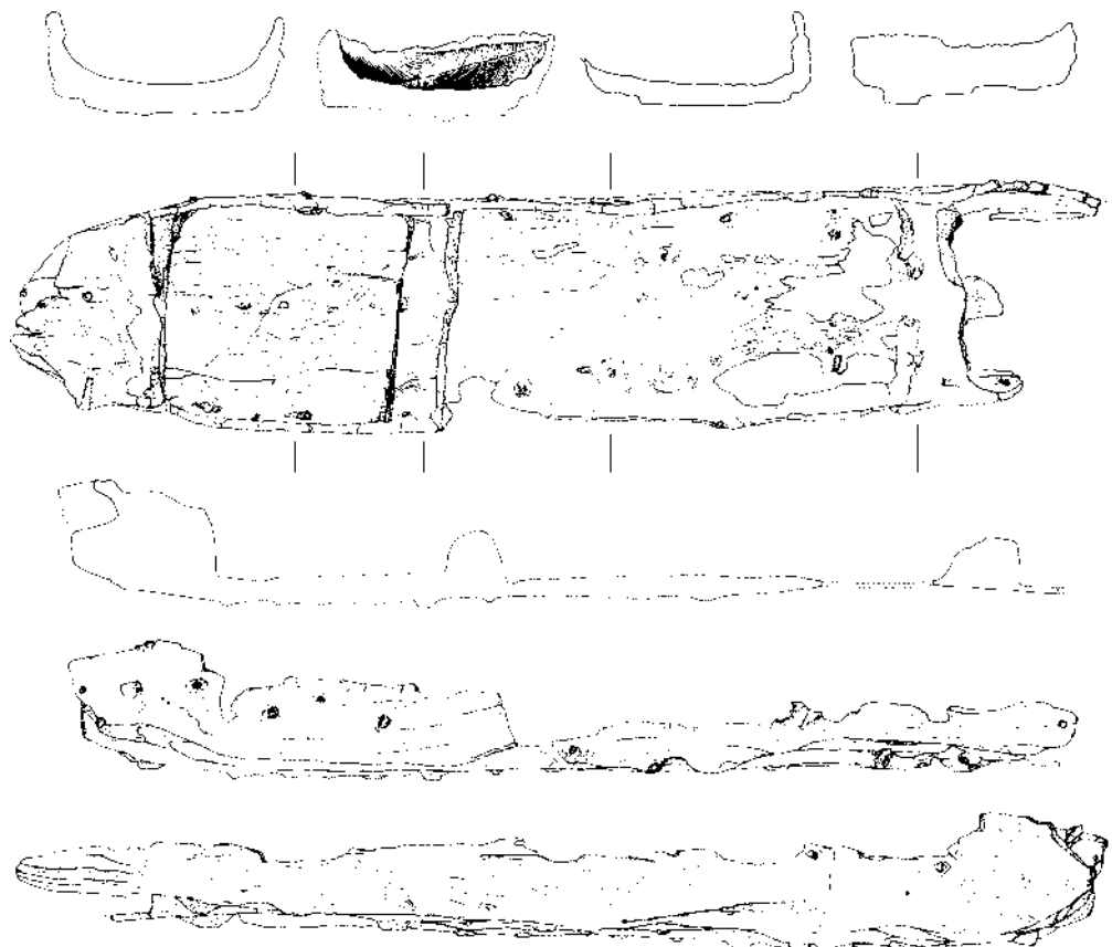
Abb. 2: Mittelalterlicher Einbaum aus dem Obersee. Gesamtlänge knapp 3,5 m (Zeichnung M. Schick, Institut für Ur- und Frühgeschichte sowie Mittelalter- und Neuzeitarchäologie, Universität Innsbruck).

Ausgehend von der Datierung des Bootes in die